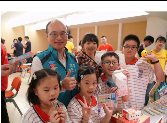
曾局長親臨記者會現場勉勵打氣