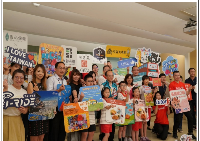
記者會出席廠商、學校師生家長與曾局長合影留念