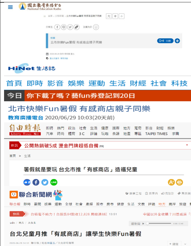
教育廣播電台、HiNet、自由時報等7家媒體報導有感商店訊息