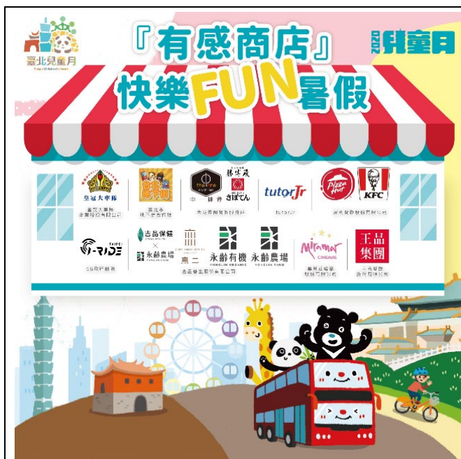
有感商店快樂 FUN 暑假文宣