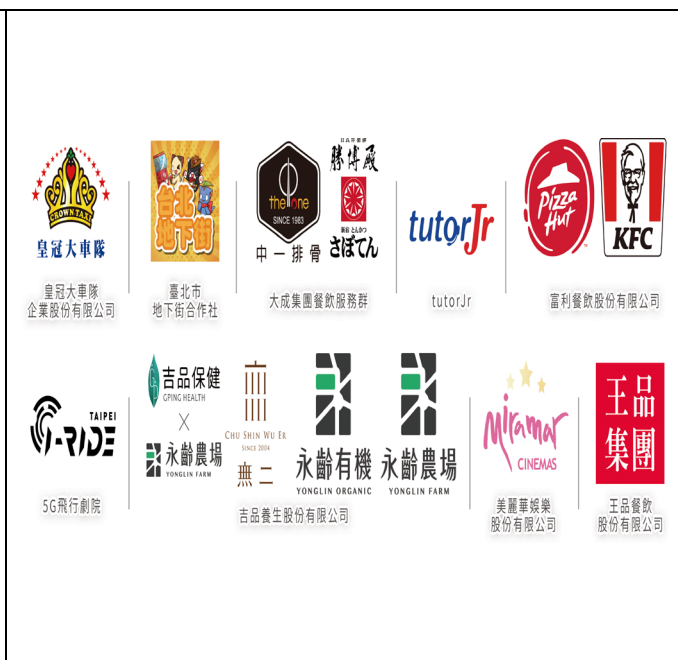
9大公司18家品牌盛情加入有感商店